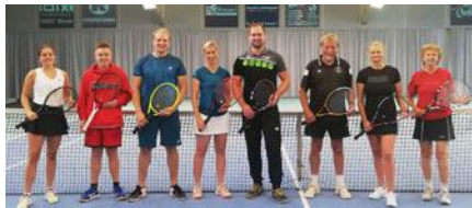
Sieger Mixed 2021