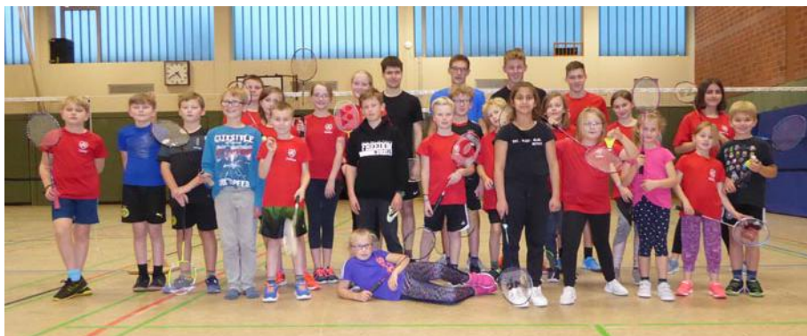
Kids und Jugendliche Freitags beim Training